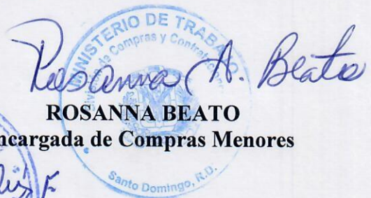
ROSANNA BEATO Encargada de Compras Menores